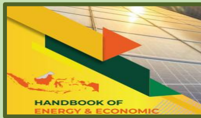
Hanbook Of Energy & Economic Statics Of Indonesia 2023