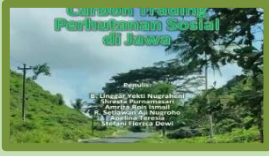
Model Carbon Trading Perhutanan Sosial Di Jawa