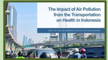
Dampak Polusi Transportasi terhadap Kesehatan