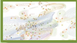
Urban Smellscapes: Understanding And Designing City Smell Environments