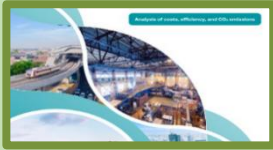
Techno-economic Analysis Of Decarbonization Technology Options For Energy End-use Sector In Indonesia