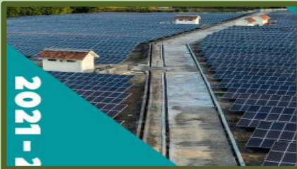
Rencana Usaha Penyediaan Tenaga Listrik (RUPTL) PT PLN (Persero)