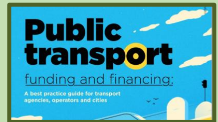
Public Transport Funding And Financing