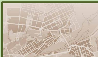
Streets as Public Spaces and Drivers of Urban Prosperity