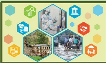
Assessing the Enabling Environment for Disaster and Pandemic Risk Financing: A Country Diagnostics Tool Kit