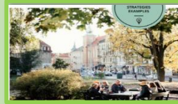
Network Of Public Spaces