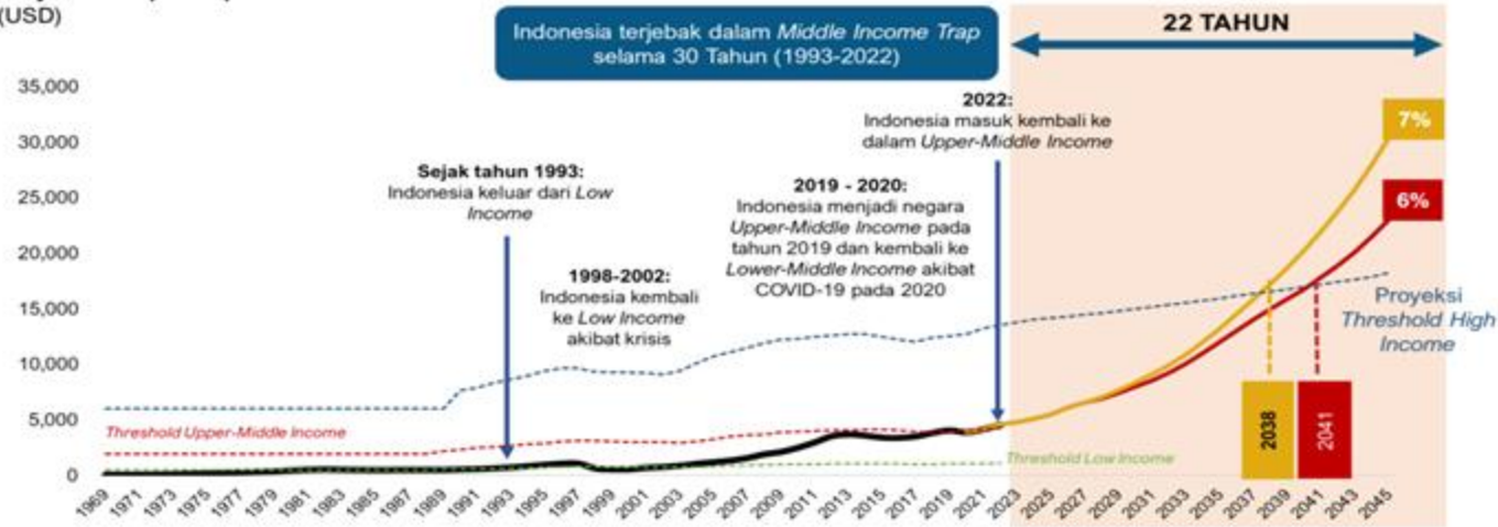
Proyeksi GNI per Capita Indonesia (USD)