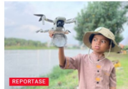
Terbangkan Domik, Detektif Sungai Temukan Mikroplastik di Langit Kediri