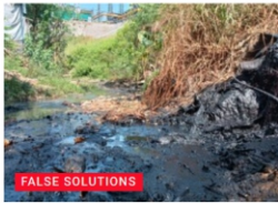
Operasional PLTSa Putri Cempo Ternyata Cemari Lingkungan Masyarakat Sekitar