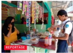
Waspada Jajanan Sekolah Tercampur Bahan Plastik, Bahaya Bagi Kesehatan Anak

AZWI memanfaatkan situs web sebagai wadah untuk menerbitkan artikel yang membahas isu-isu terkini secara mendalam. Artikel ini bertujuan untuk memperkaya pengetahuan masyarakat dan memaksimalkan jangkauan kampanye baik dari member maupun AZWI. Beberapa artikel yang telah tayang di antaranya: