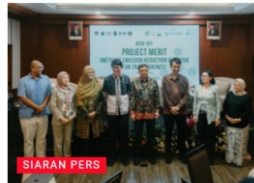
Dietplastik Indonesia, YPBB Bandung dan PPLH Bali Luncurkan Project MERIT untuk Petakan Emisi Metana di TPA 3 Provinsi