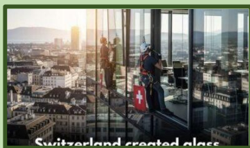
Switzerland Is Redefining What Solar Energy Can Look Like