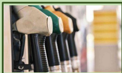
Harga BBM Melambung, Bagaimana Masyarakat Bertahan? Pengalaman Menghadapi Lonjakan Bensin di California