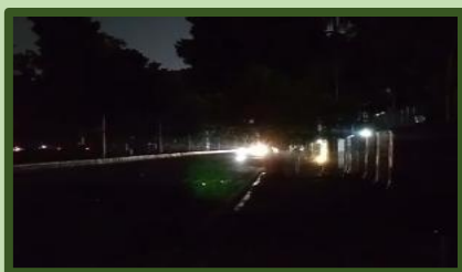
Dinas Bina Marga Provinsi DKI Jakarta Mendukung Aksi Hemat Energi dan Pengurangan Emisi Karbon