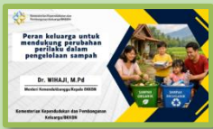
Sudut Pandang Parenting dan Keluarga (Relatable & Hangat)