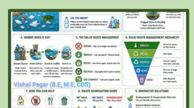
Plastic Pollution & Waste Management