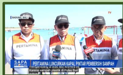
Kapal Pintar Pembersih Sampah Perairan di Luncurkan Pertamina