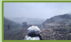
Makassar Larang Sampah Organik Masuk TPA, Targetkan Pengurangan Volume Sampah Lebih dari 50 Persen