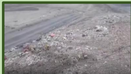
Kebohongan Daur Ulang dan Penjajahan Sampah