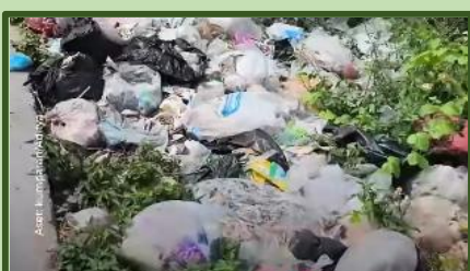
Tumpukan Sampah Liar di Babelan Dikeluhkan Warga, Minta Pemkab Bekasi Sediakan Fasilitas Penampungan