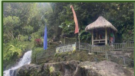
Green Tourism Menciptakan Pengalaman Wisata Yang Berkesan, Studi Pada Uma Anyar Waterfall Gianyar, Bali