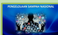
Kekuatan Jejaring Sosial: Ujung Tombak Edukasi Pengelolaan Sampah di Era Digital