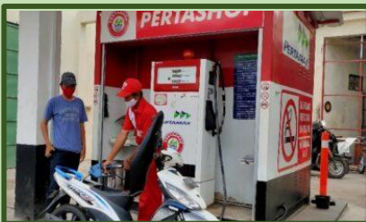
Pertamax Bukan Hanya untuk Kendaraan: Energi Produksi yang Kerap Terlupakan