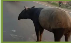
Tragedi Tapir di Mesuji Jadi Alarm, Pegiat Konservasi Dorong Pendidikan Lingkungan Sejak Usia Dini