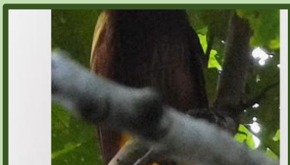
Kampung Klabili di Papua Barat Daya punya hutan sebagai pariwisata berbasis lingkungan