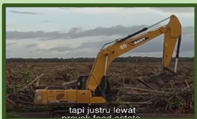
Kalau Beras Langka, Kita Makan Apa?