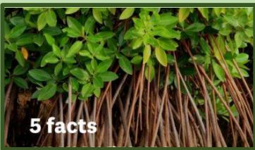
5 fact on mangroves