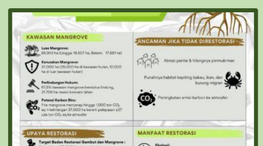
37.000 Hektare Mangrove Di Kepulauan Riau Rusak