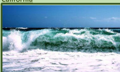
Di Balik Debur Ombak, Tersimpan Energi Masa Depan Indonesia