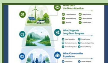
The Hidden layers of Sustainability