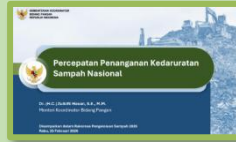
Percepatan Penanganan Kedaruratan Sampah Nasional: Arahan Menko Pangan di Rakornas 2026