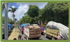
Duh, Sampah Di Bali Disorot Media Asing