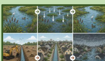
Nature Already Solved Flooding