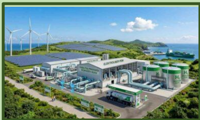
Green Hydrogen Harapan Baru Penyimpanan Energi Terbarukan Di Indonesia