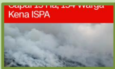
Kebakaran TPA Jatiwaringin meluas capai 15 Ha, 154 Warga kena ISPA