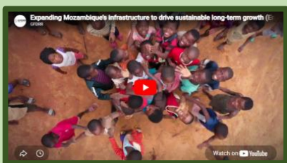
Expanding Mozambique's infrastructure to drive sustainable long-term growth