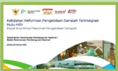
Menuju Lingkungan Berkelanjutan: Bappenas Dorong Reformasi Pengelolaan Sampah Terintegrasi Hulu-Hilir